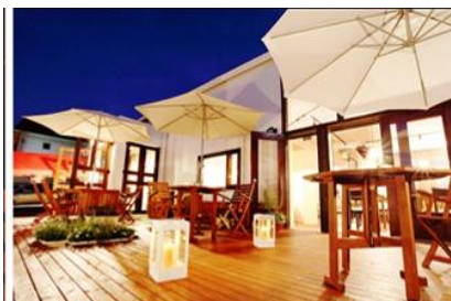
平成22年12月28日オープンの下野農園(栃木農業支援レストラン)